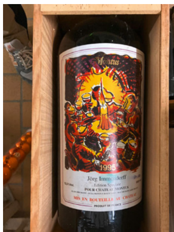
Montus mit Künstleretikett

567 1 Flasche, 1955 pro Lot CHF 1000–1800