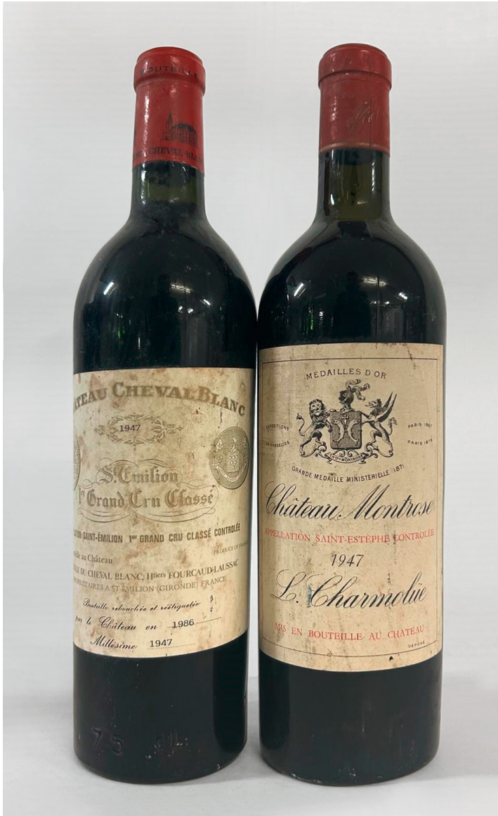
Château Cheval Blanc und Château Montrose 1947

Schätzungen, Expertisen, Degustationen, Wein-Diners, Weinreisen, Raritätenweine, Auktionen, Weinbörsen