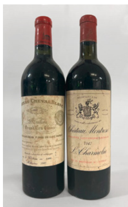
1947er Ch. Cheval Blanc und Ch. Montrose

508 1 Flasche, 1947 pro Lot CHF 800–1200